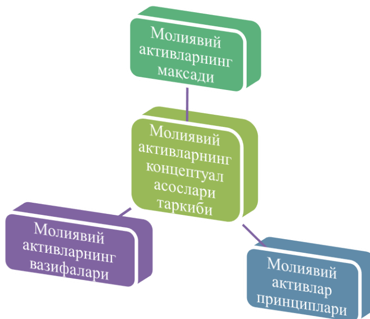
2-расм. Молиявий активларнинг концептуал асослари таркиби 5

Юқоридаги фикрлардан келиб чиқиб, айтишимиз мумкинки, бизнинг фикримизча, молиявий активларнинг концептуал асослари – бу молиявий ахборот фойдаланувчилар талабларини қондириш учун молиявий активларнинг мақсади, вазифалари ҳамда принципларини ўзида мужассамлаштирадиган молиявий активлар таркиби ва элементларини тавсифловчи бўғиндир.