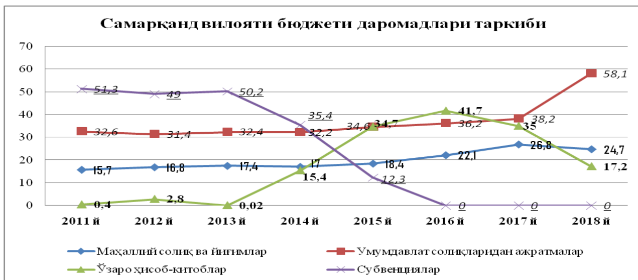
1-расм. Самарқанд вилоят маҳаллий бюджети даромадлари ва унинг таркибининг ўзгариш динамикаси, фоизда[6]

Вилоят бюджети даромадлари таркиби ва тузилишининг сўнгги йиллардаги ўзгариш динамикасининг таҳлили кўрсатмоқдаки, унинг таркибида солиқлар ва солиқсиз тўловлардан тушумлар (даромадлар жами) ҳамда субвенция ва маҳаллий бюджетга бериладиган даромадларни доимий равишда ўсиб бориши кузатилган.