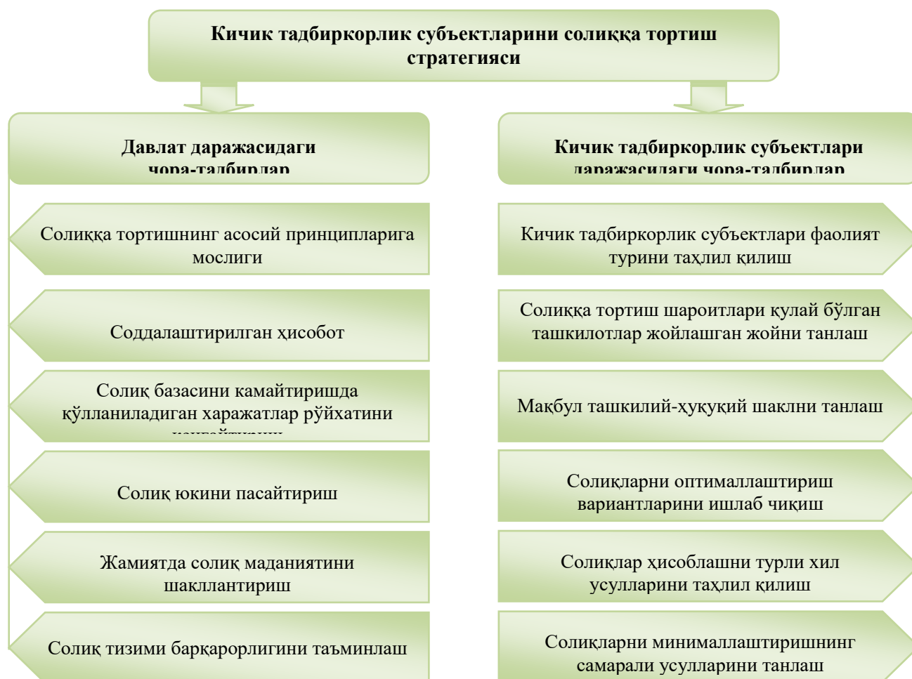
2-расм. Кичик тадбиркорлик субъектларини солиққа тортиш стратегияси

Маълумки, мустақиллик йилларида кичик тадбиркорлик субъектларини солиққа тортиш бўйича кўплаб қонуний ҳужжатлар ишлаб чиқилиб, амалиётга татбиқ этилди, натижада республикада мулкдорлар синфи шаклланди. Истиқболда кичик тадбиркорликни барқарор ривожланиши ва соҳа самарадорлигини таъминлаш учун давлат томонидан кичик тадбиркорлик субъектларини солиққа тортиш стратегиясини ишлаб чиқиш мақсадга мувофиқ, деб ўйлаймиз. Уни амалга ошириш солиқ қонунчилиги меъёрларини бузмаган ҳолда кичик тадбиркорлик субъектларининг солиқ харажатларини камайтириш ва уларни барқарор ривожланиши учун шароит яратади (2-расм).