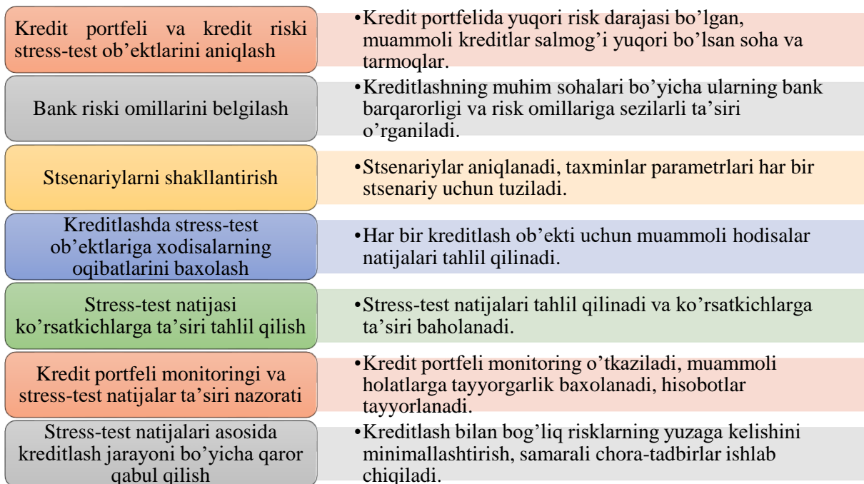
2-rasm. Bank kredit portfeli va kredit riskini stress-testdan o'tkazish bosqichlari[3]

Bank kredit portfeli va kredit riskini stress-testdan o'tkazish bir necha bosqichlarda amalga oshirilishi lozim. Buni quyidagi rasmda ko'rish mumkin.