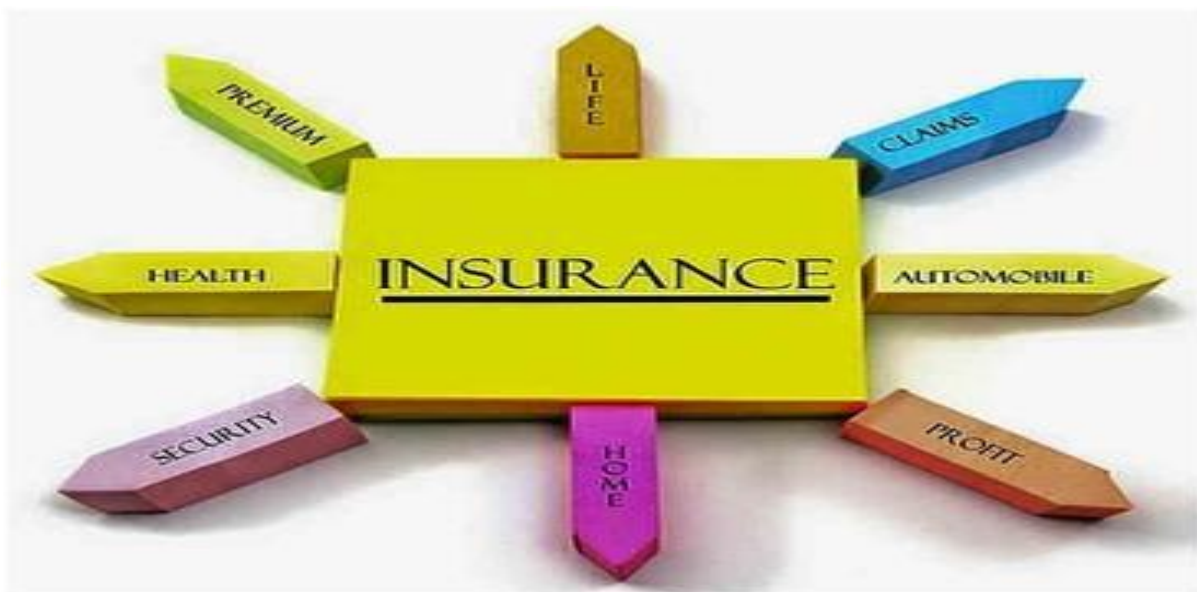
2-rasm Sug'urta bozori ishtirokchilari faoliyati

Natijalar shuni ko'rsatadiki, sug'urta tashkilotlari daromadlarini hisobga olishning samarali tizimi moliyaviy barqarorlikni ta'minlash, xalqaro moliyaviy standartlarga muvofiqlikni oshirish va investorlarga ishonchni kuchaytirish uchun hal qiluvchi ahamiyatga ega. Shu bilan birga, tadqiqot ma'lumotlariga asoslanib, daromadlarni hisobga olish jarayonini takomillashtirish bo'yicha ilmiy asoslangan tavsiyalar ishlab chiqildi, ular sug'urta kompaniyalarining moliyaviy