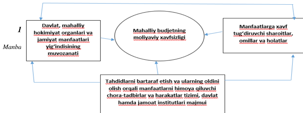
2-rasm. Moliyaviy xavfsizlikni ta'minlash mexanizmi