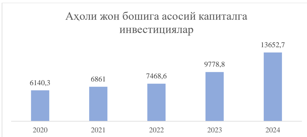
2-расм. Аҳоли жон бошига асосий капиталга инвестициялар ҳажми (йиллик, минг сўм.) 1

Мамлакатимизда таълим соҳаси бўйича олиб борилаётган ва уларни қўллаб-қувватлашга қаратилган чоратадбирлар натижаси таҳлилини ўрганиб чиқишни мақсадга мувофиқ деб ҳисоблайминз.