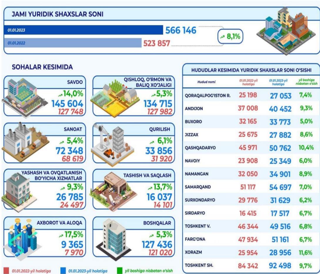
2-rasm. 2022-yil davomida yuridik shaxslar soni dinamikasi [7]

Ma'lumki, tadbirkorlik muhitini yaratish aholi bandligini ta'minlash va turmush sharoitini yaxshilash bevosita amalga oshirilayotgan ijobiy soliq islohotlariga bog'liq bo'ladi. Soliq tizimida olib borilayotgan islohotlar natijasida 2022-yilda mamlakatimiz hududida ro'yxatdan o'tgan yuridik shaxslar soni 8.1 foizga o'sishga erishildi (2-rasm) [7]: