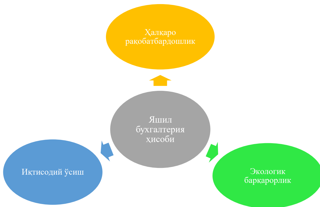
2-расм. Ўзбекистонда яшил бухгалтерия ҳисобини жорий этишдаги имкониятлари

Мамлакатнинг сув танқислиги ва тупроқ деградацияси каби муаммолар билан курашаётганини эътироф этган ҳолда, яшил ҳисоб табиий ресурслардан барқарор фойдаланишни таъминлаш учун жуда муҳимдир. Бу экологик харажатлар ва фойдаларни акс эттирувчи иқтисодий кўрсаткичлар зарурлигини таъкидлайди.