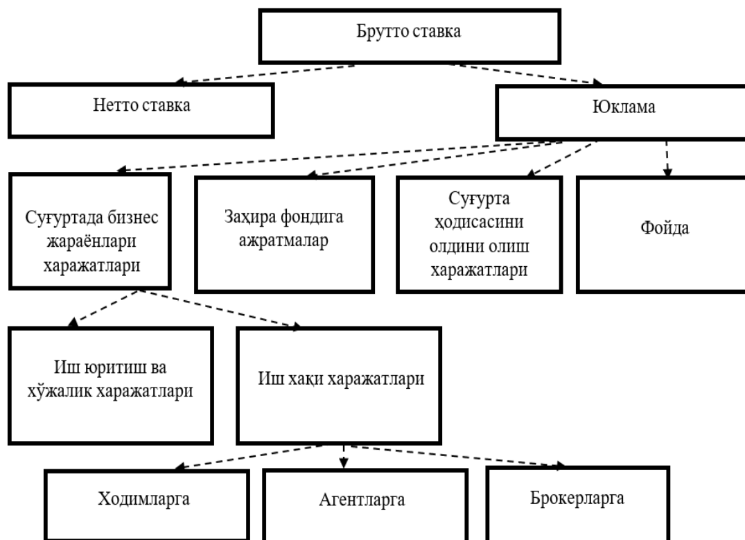
1-расм. Суғурта тарифининг таркиби[8]

Суғурта тарифининг брутто ставка қисмини белгилаш суғурта шартномаси тури, объекти ва унга белгиланган рисклар орқали аниқланади. Бунда суғурта статистикаси ва прогнози амалга оширилади, кўп йиллик таҳлил ва рисклар аниқланади, эҳтимоллар назариясининг тамойилларига асосланиб, суғурта турининг рисклилиқ даражаси аниқланади, суғурта ставкасининг брутто қисмини белгилаш, суғурта компаниясининг хошиш иродаси билан боғлиқ эмас, яъни нетто ставка махсус ҳисоб-китобларни талаб этади.