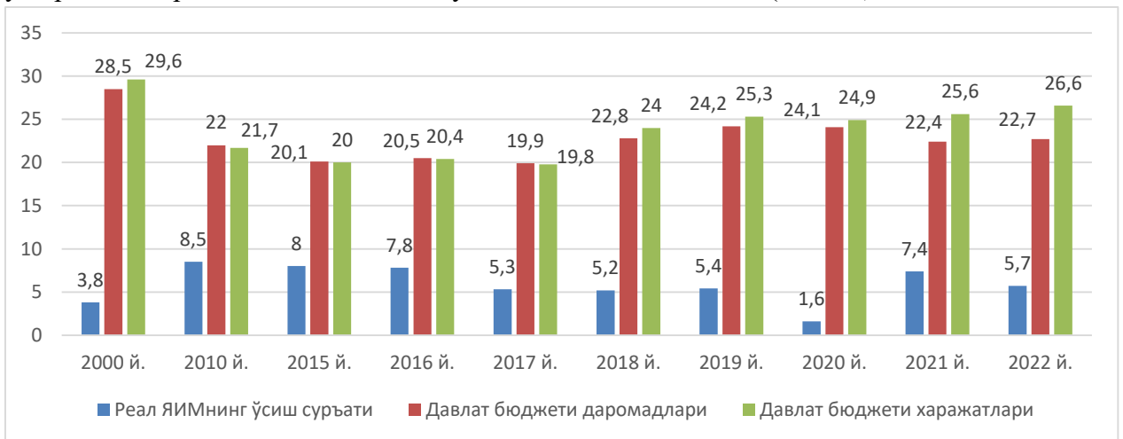
2-расм. 2000-2022 йилларда реал ЯИМ ўсиш суръатлари, давлат бюджети даромадлари ва харажатлари (ЯИМ нисбатан фоиз ҳисобида) [10]

Мамлакатимизда реал ЯИМнинг ўсиш суръатларини таҳлил қиладиган бўлсак, 2000-2022 йиллардаги энг паст тенденция 2000, 2020 йилларда кузатилган. 2020 йилда эса мазкур кўрсаткич иқтисодий пандемия ҳолатига қарамасдан 1,6 фоизга ўсиши таъминланган. Реал ЯИМнинг энг юқори ўсиш суръатлари 2010, 2015 ва 2016 йилларда кузатилган, бунда ўсиш суръати ўртача 8,0 фоизлик даражани ташкил этган. Шунга мос равишда давлат бюджети даромадлари ЯИМга нисбатан ўртача 21,0 фоизлик, давлат бюджети харажатлари эса ЯИМга нисбатан қарийиб 21,0 фоизлик даражаларни ташкил этган (2-Расм).