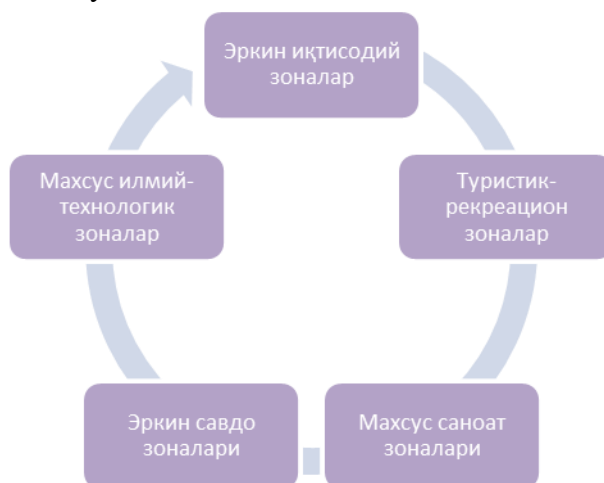
1 – расм. Махсус иқтисодий зоналар турлари

зоналар қуйидаги турда ташкил этилиши мумкин: