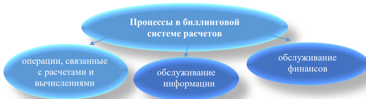
Рисунок 2. Составные части процесса биллинга 2

Само определение billing в переводе означает «выписывание счёта». Рассмотрим работу этого процесса. Если рассматривать Биллинг, как автоматизированную систему расчетов, то можно выделить три её основные части см. Рис 2.