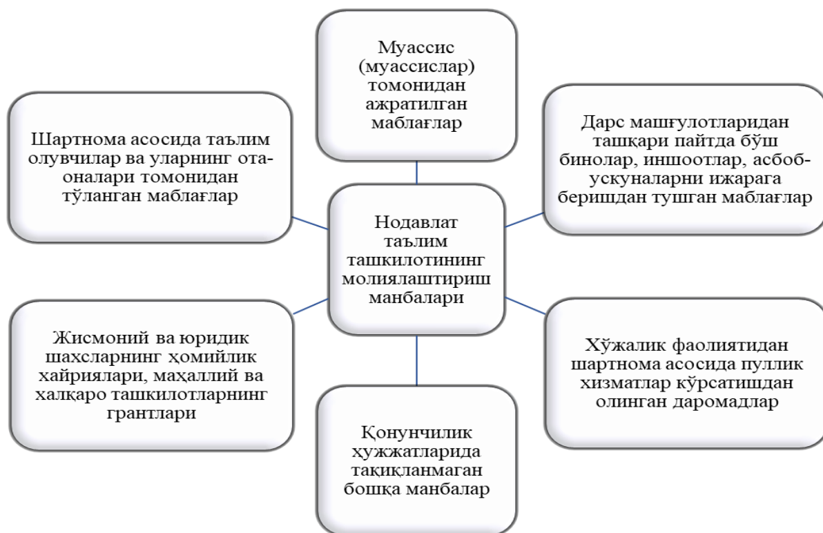
2-расм. Хусусий таълим ташкилотини молиялаштириш манбалари 4

Хусусий таълим ташкилотлари бухгалтерия ҳисобининг муҳим муммоларидан бири айнан мазкур ташкилотларда молиялаштириш билан боғлиқ хўжалик муомалаларини ҳисобда акс эттириш услубиётидир. Хусусий таълим ташкилотларини молиялаштириш манбаларини 2-расмда кўришимиз мумкин.