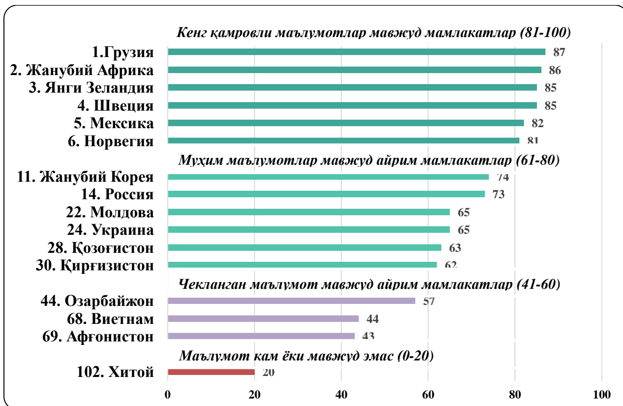
3-расм. Бюджет очиклиги индекси (Open Budget Index-OBI) 2021 натижалари 7

“Бюджет очиклиги индекси” (Open budget index) глобал миқёсда баҳолаб боровчи ташкилот Халқаро бюджет ҳамкорлик ташкилоти (International Budget Partnership) тонидан ижобий баҳолаш учун тавсиялар ишлаб чиқилган.