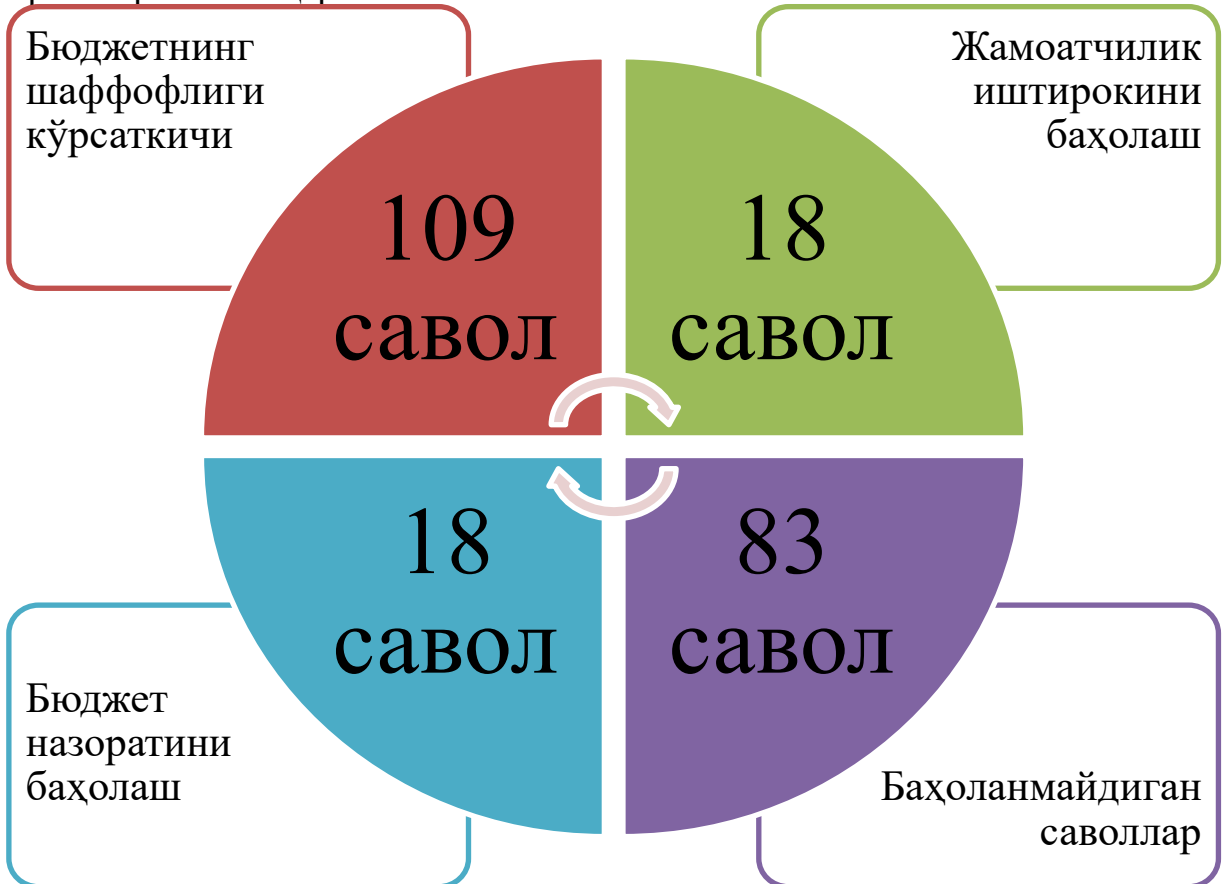
2-расм. Бюджет очиклиги сўровномаси (Open Budget Survey-OBS)нинг таркибий компонентлари 5 .

Бюджет очиклиги сўровномаси (Open Budget Survey-OBS)нинг таркиби тўртта компонент бўйича саволларга жавоб олинади.