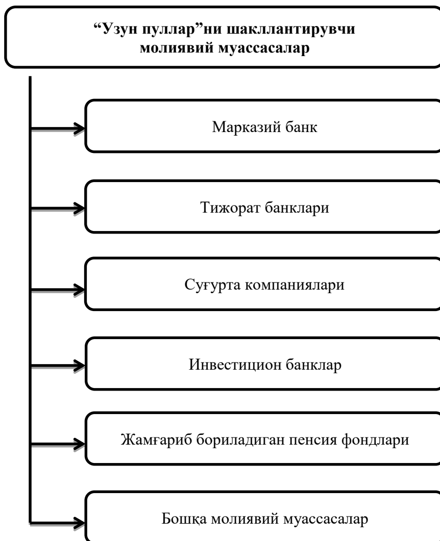
1-расм. “Узун пуллар”ни шакллантирувчи молиявий муассасалар 1

1-расмдан кўриниб турибдики, “узун пуллар”ни “ишлаб чиқарувчи” молиявий муассасалар таркибида банк тизими, суғурта компаниялари ва жамғариб бориладиган пенсия фондлари ўрин олган. Бироқ, таъкидлаш жоизки, улар “узун пуллар”ни “ишлаб чиқиш”да турлича ваколат ва имкониятга эга бўлиш билан бирга, мамлакат пул массасини ошириш ёки камайтиришга бевосита ва билвосита таъсир қилиши мумкин, шунингдек улар томонидан яратилган “узун пуллар”нинг иқтисодиётга таъсири жиҳатидан ижобий ва салбий жиҳатлари мавжуд. Масалан, Марказий банк бевосита “узун пуллар”ни яратмасда иқтисодиётда пул массасини оширишга бевосита таъсир қилувчи ва “узун пуллар”нинг асосини яратувчи монопол молиявий муассаса ҳисобланади, Марказий банк томонидан муомалага чиқарилган пуллар иқтисодиётдаги товар массасига нисбатан ҳаддан зиёд ортиб кетиши баҳоларнинг ошишига олиб келиш билан бирга, миллий валютанинг