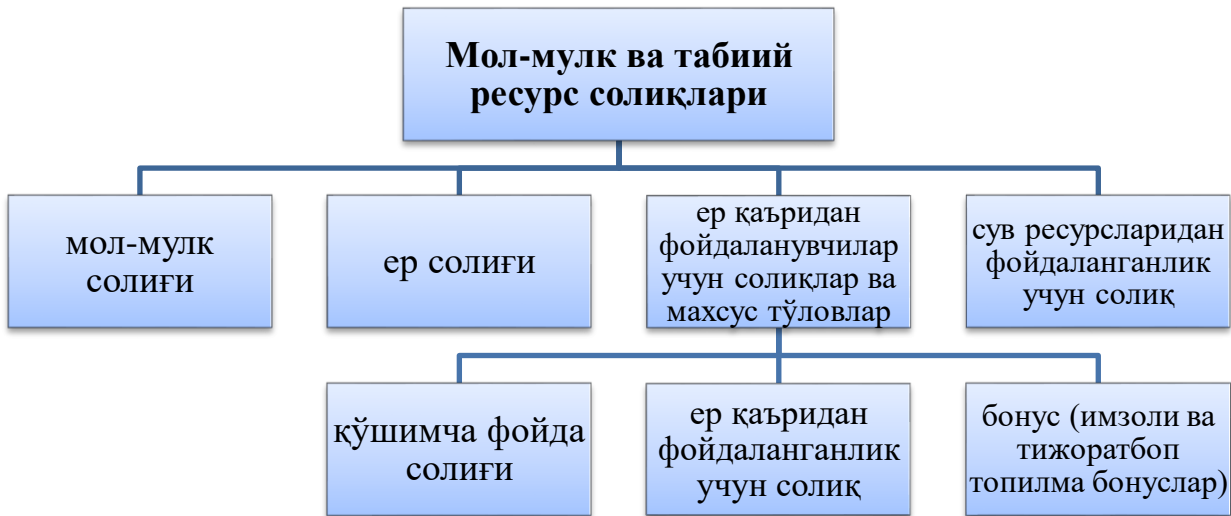
1-расм. Табиий ресурс ва мол-мулк солиқлари таркиби

тўловлари ва мол-мулк солиғи ҳам алоҳида амамиятга эга. Бугунги кунда улар таркиби қуйидагилардан иборат (1-расм).