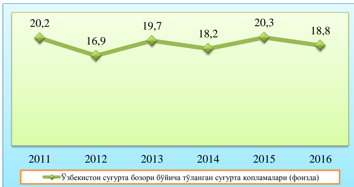
2-расм. Ўзбекистон суғурта бозорида 2011-2016 йиллар бўйича тўланган суғурта қопламалари (фоизда) 2

камайган (2-расм). Хулоса қилиб айтганда ўтган 5 йил давомида суғуртанинг ҳимоялаш функциясида сезиларли даражада ўзгаришлар юз бермаган бўлсада, 2016 йилда 2011 йилга нисбатан тўланган суғурта қопламаларининг йиғилган суғурта мукофотларига нисбатан 1.4 пунктга пасайиш кузатилган.