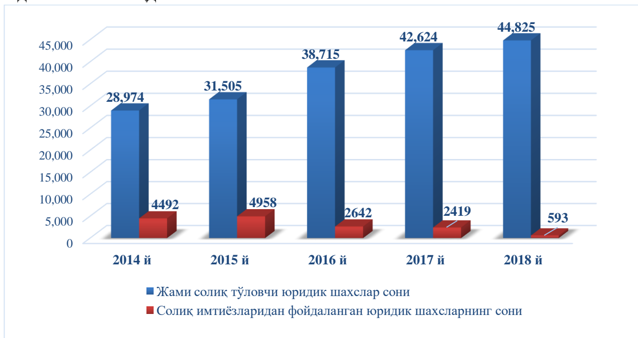
1-расм. Самарқанд вилояти бўйича солиқ имтиёзларидан фойдаланаётган юридик шахсларнинг сони[5], сонда

Самарқанд вилоятида мавжуд бўлган жами хўжалик юритувчи субъектлар ёки солиқ тўловчиларнинг ўртача 9,2 фоизи солиқ имтиёзларидан фойдаланиб келмоқда.