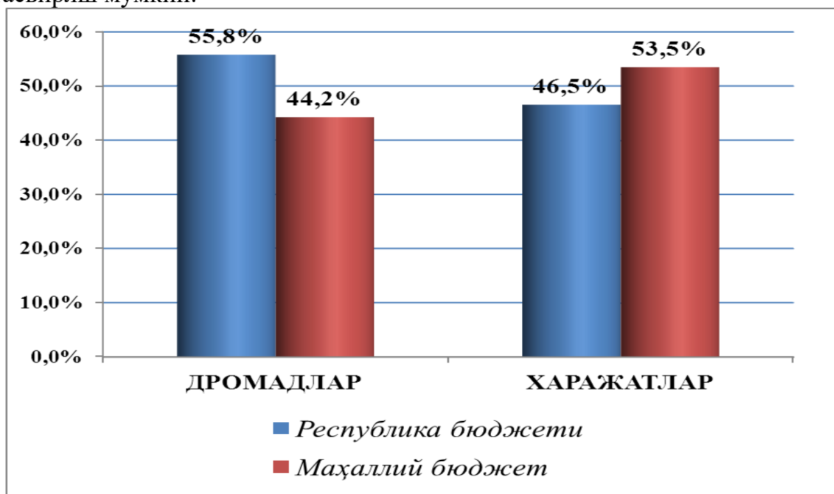
1-Расм. 2015 йилда республика бюджети, Қорақалпоғистон Республикаси бюджети, вилоятлар ва Тошкент шаҳар бюджетлари даромадлари ва харажатларининг Давлат бюджетигаги улуши [3]

Ўз навбатида Давлат бюджетининг шаклланишида маҳаллий бюджетлар муҳим аҳамият касб этади. 2015 йилда маҳаллий бюджетларнинг даромадлари улуши Давлат бюджетининг даромадларининг 44,2 фоизини ёки 2014 йилга нисбатан 2 561,5 млрд сўмга (ўсиш 18,9 фоиз), харажатларининг улуши эса 53,5 фоизни ёки ўтган йилга нисбатан 2 081,9 млрд. сўмга (ўсиш 12,0 фоиз) ошди. Жумладан, давлат бюджетини шаклланишида маҳаллий бюджетнинг улуши ҳам сезиларли даражада оширилди. Бунинг қуйидаги расм орқали тасвирлш мумкин.