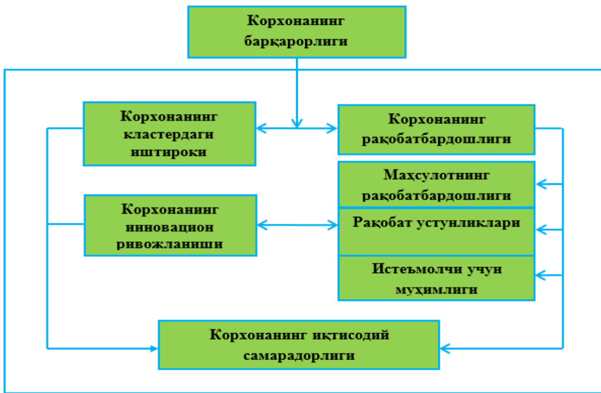
1-расм. Корхона барқарорлиги элементларининг тузилмаси 1

интервалларида бу иккала тушунча тенг кучга эга бўлади.