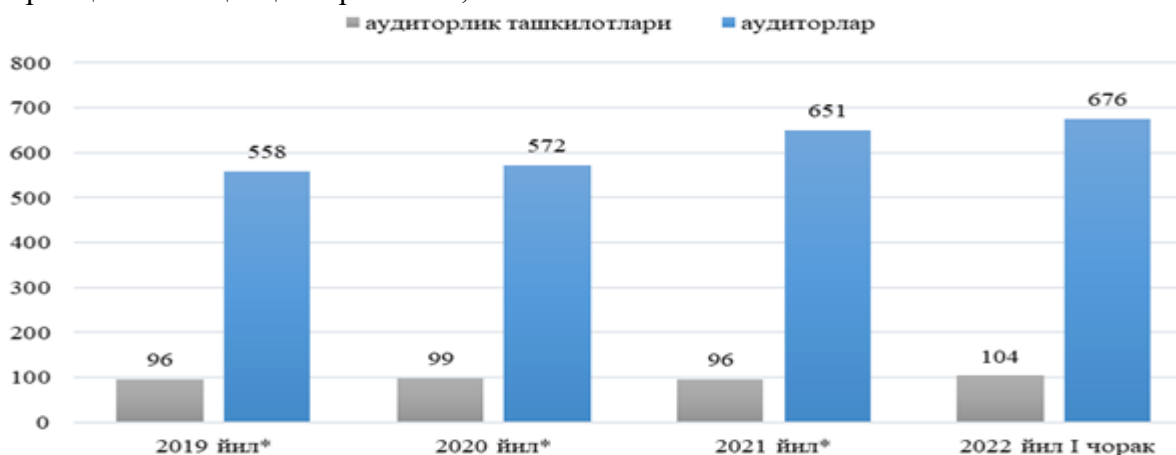
1-расм. Ўзбекистон Республикаси аудит хизматлари бозорида фаолият юритаётган аудиторлик ташкилотлари ва аудиторлари тўғрисида маълумот 1

Республикаимизнинг барча ҳудудларида аудиторлик хизматлари бозорининг ривожланиши учун шароитларни янада яхшилаш ва аудиторлик фаолиятини тартибга солишда халқаро стандартларга мувофиқ замонавий ёндашувларни жорий этишнинг асосий мақсадларидан бири ҳам айнан халқаро стандартлар асосида, аудиторлик хизматлари сифатини оширишга ва ишбилармонлар ҳамжамиятининг аудиторлик ташкилотлари иши натижаларига ишончини қўллаб-қувватлашга қаратилган аудиторлик ташкилотлари иши сифатини ташқи назорат қилишнинг таъсирчан механизмини ишлаб чиқиш ҳисобланади