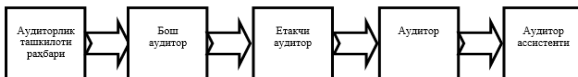
3-расм. Аудиторлик ташкилотида мансаб поғонаси

Хулоса. Аудит ўтказиш чоғида бажариладиган ишлар нуқтаи назаридан, аудиторлик ташкилотининг профессионал ходимларини қуйидаги тоифаларга бўлиш тавсия этилади: