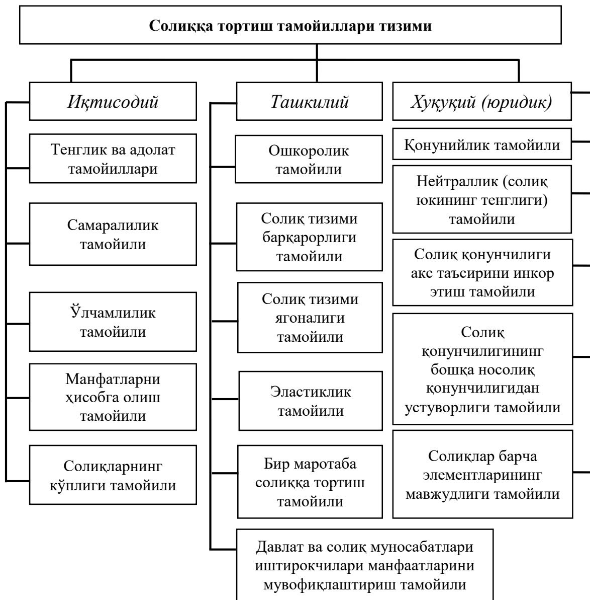
1-расм. Солиққа тортиш тамойилларининг тизимлаштирилиши

бўлган солиққа тортиш тамойилларини қўйидаги мезонлар бўйича гуруҳлаш таклиф этилади (1-расм) [10].