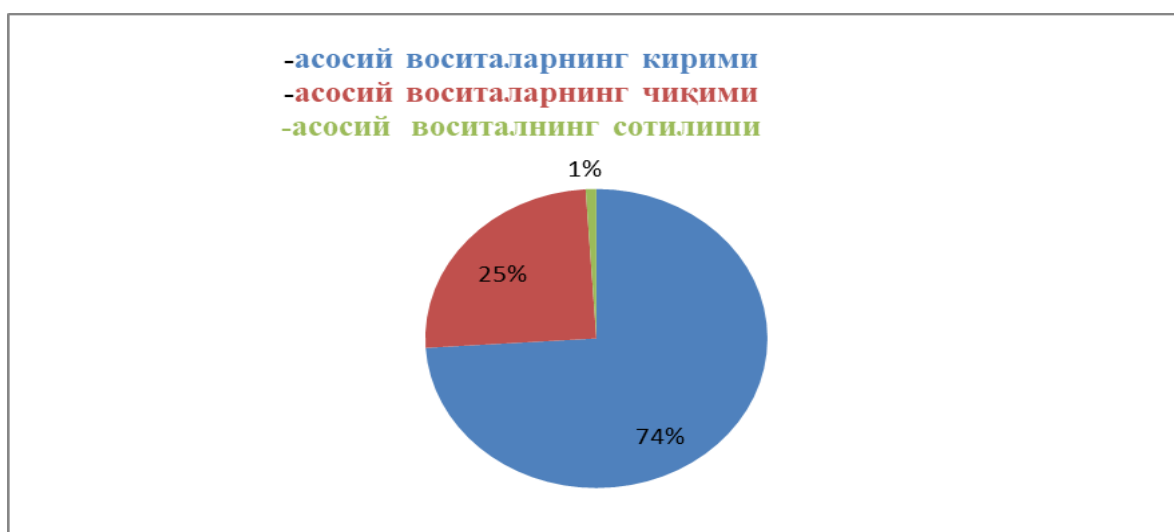
1-расм. "GALLA-ALTEG" АЖда 2017-2021 йилларда асосий воситалар ҳаракатининг диаграммаси