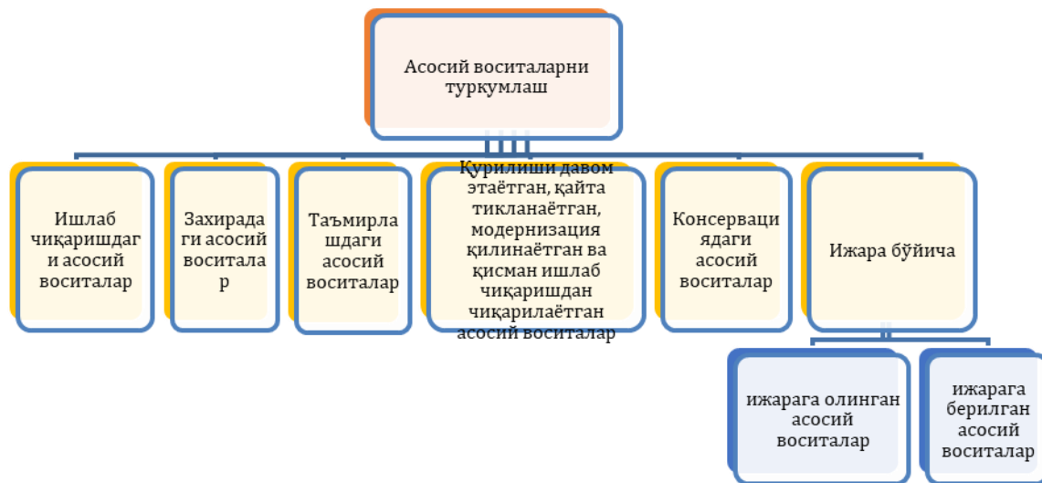
3-расм. “Ўздонмахсулот” АҚ тизимидаги корхоналарда асосий воситаларнинг туркумланиши

“GALLA-ALTEG” АЖДа ушбу таклифни амалиётда қўллашни жорий этиш мақсадида 2021 йил 1 чорак ҳолати бўйича таҳлил қилинганда, захирадаги асосий воситалар, таъмирлашдаги асосий воситалар, консервациядаги асосий воситалари мавжуд эмас. Қурилиши давом этаётган асосий воситалар 1 022 200 минг сўм, ижарага берилган асосий воситалар ҳам мавжуд эмас. Ижарага олинган асосий воситалар эса, 135 897 минг сўм, ишлаб чиқаришдаги асосий воситалар 7 422 185 минг сўмни ташкил этади. Бундан кўриниб турибдики, асосий воситаларни асосий қисми ишлаб чиқаришда иштирок этмоқда.