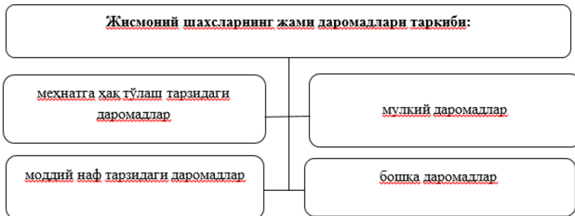
3-расм. Жисмоний шахсларнинг жами даромадлари таркиби [18].

Иш берувчи билан меҳнатга оид муносабатларда бўлган ва тузилган меҳнат шартномасига (контрактига) мувофиқ ишларни бажараётган жисмоний шахсларга ҳисобланадиган ва тўланадиган барча тўловлар меҳнатга ҳақ тўлаш тарзидаги даромадлар деб эътироф этилади. Меҳнатга ҳақ тўлаш сифатидаги даромадлар таркибига солиқ қонунчилигига мувофиқ белгиланган рағбатлантириш хусусиятига эга тўловлар, компенсация ва ишламаган вақт учун ҳақ тўлашдан жисмоний шахс оладиган даромадлар ҳам киритилади.