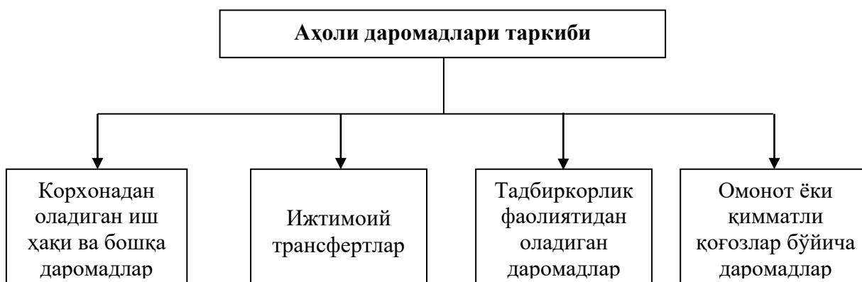
1-расм. Аҳоли даромадлари таркиби [4]

Материал ва метод. Аҳоли даромадлари тушунчасига эътибор қаратадиган бўлсак, барча аҳолига тегишли бўлган пул ва натурал (маҳсулот шаклида) тушумлар ҳамда кўрсатилган хизматлар суммаси аҳоли даромадларини ифода этади [24] –. Аҳолининг жами турдаги даромадлари манбаи — иш ҳақи, пенсия, стипендия, нафақалар, мукофот, фойда, дивиденд, заём ва лотерея ютуғи, банк тўлаган фоиз пули, кўчмас мулкдан келган рента тўлови ва ижара пули, суғурта қопламалари каби даромадлардан иборат.